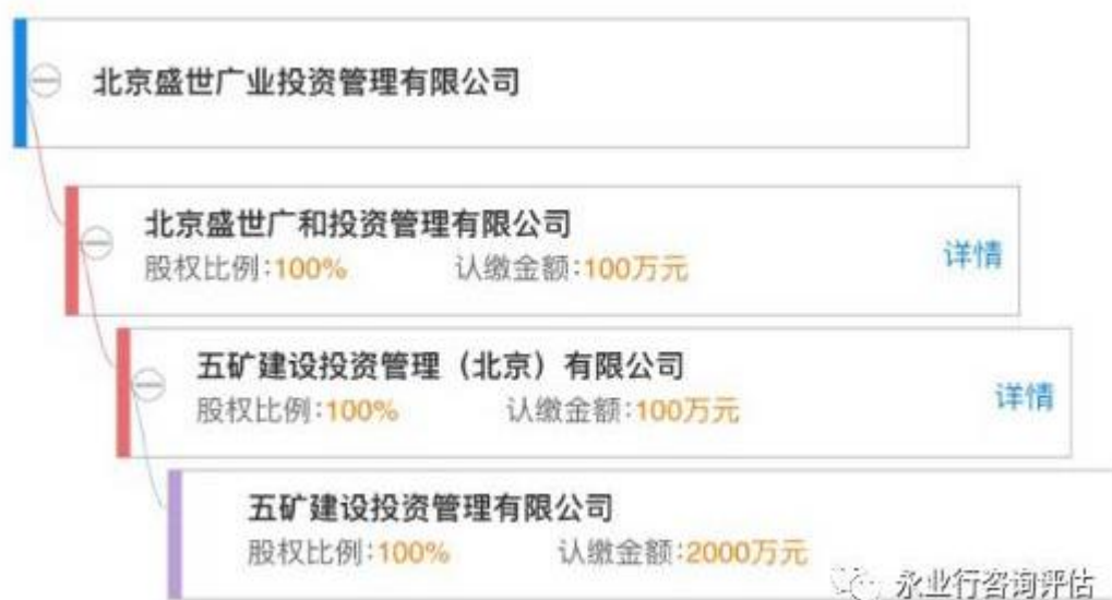
（图：北京盛世广业投资管理有限公司股权结构图）

081 号地块于上午 9：30 进行现场一次报价，共有 21 家企业参与现场一次报价。最终该地块被北京盛世广业投资管理有限公司以总价 101088 万元竞得，楼面价 6751 元/m 2 ，溢价率 69%。据查北京盛世广业投资管理有限公司为五矿集团旗下子公司，本次也是五矿继 5 月 23 日首次进入武汉，布局盘龙城之后，再次落子武汉。五矿地产区域布局主要集中在环渤海、长三角及珠三角 3 大核心城市圈和重点中西部城市，目前已进入的城市主要有北京、天津、南京、长沙、沈阳等。