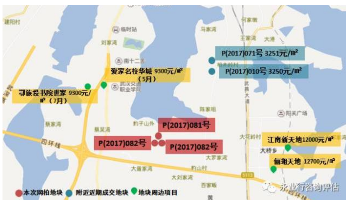
（图：项目周边成交地块及项目分布图）

以带装修出售，整体价格有所拉升，均价在 12000-13000 元/m 2 水平。在售项目俩湖天地主推建面 78、103、112 m 2 房源，均价 12700 元/m 2 （含 2500 元/m 2 装修价）；9 月 10 日开盘的江南新天地 91、110 m 2 房源销售均价 12000 元/m 2 （含 2000 元/m 2 装修价），已售罄。此外早期已售罄项目爱家名校华城、鄂旅投书院世家毛坯房源均价 9300 元/m 2 。